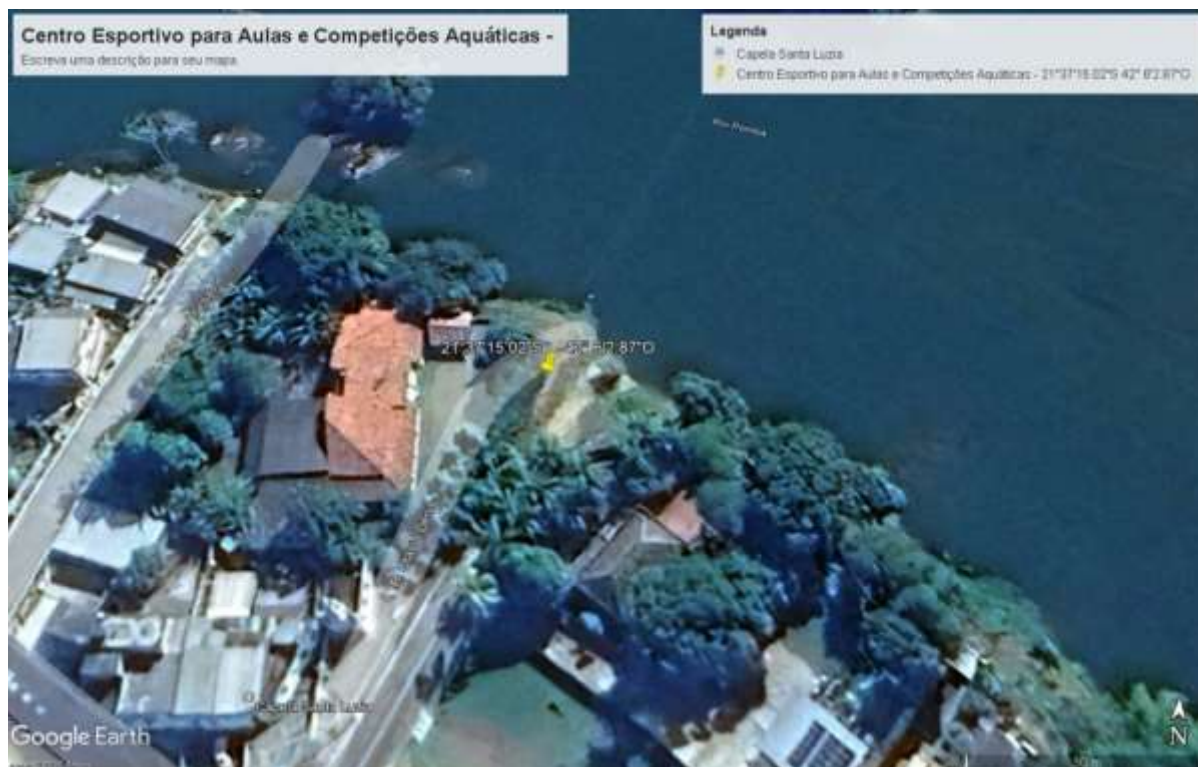
Imagens google earth

PROJETO BÁSICO DE CENTRO ESPORTIVO PARA AULAS E COMPETIÇÕES AQUÁTICAS JUNTO AO RIO POMBA, TAIS COMO, CANOAGEM, CAIAQUE, RAFTING, NATAÇÃO